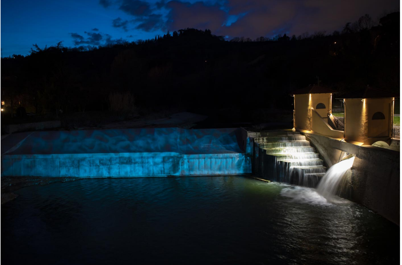
Canali Nascosti a Bologna nel Novecento