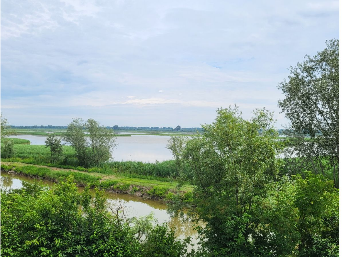
Oasi di Campotto e Museo delle Valli

Uno degli itinerari che un Bolognese non dovrebbe fare a meno di percorrere, è quello che porta all'interno dell'Oasi di Campotto, a pochi chilometri da Medicina.