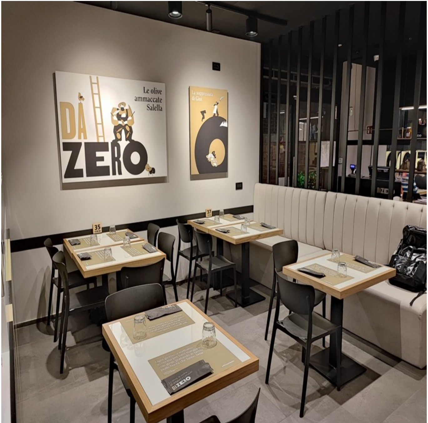
Interni della pizzeria.