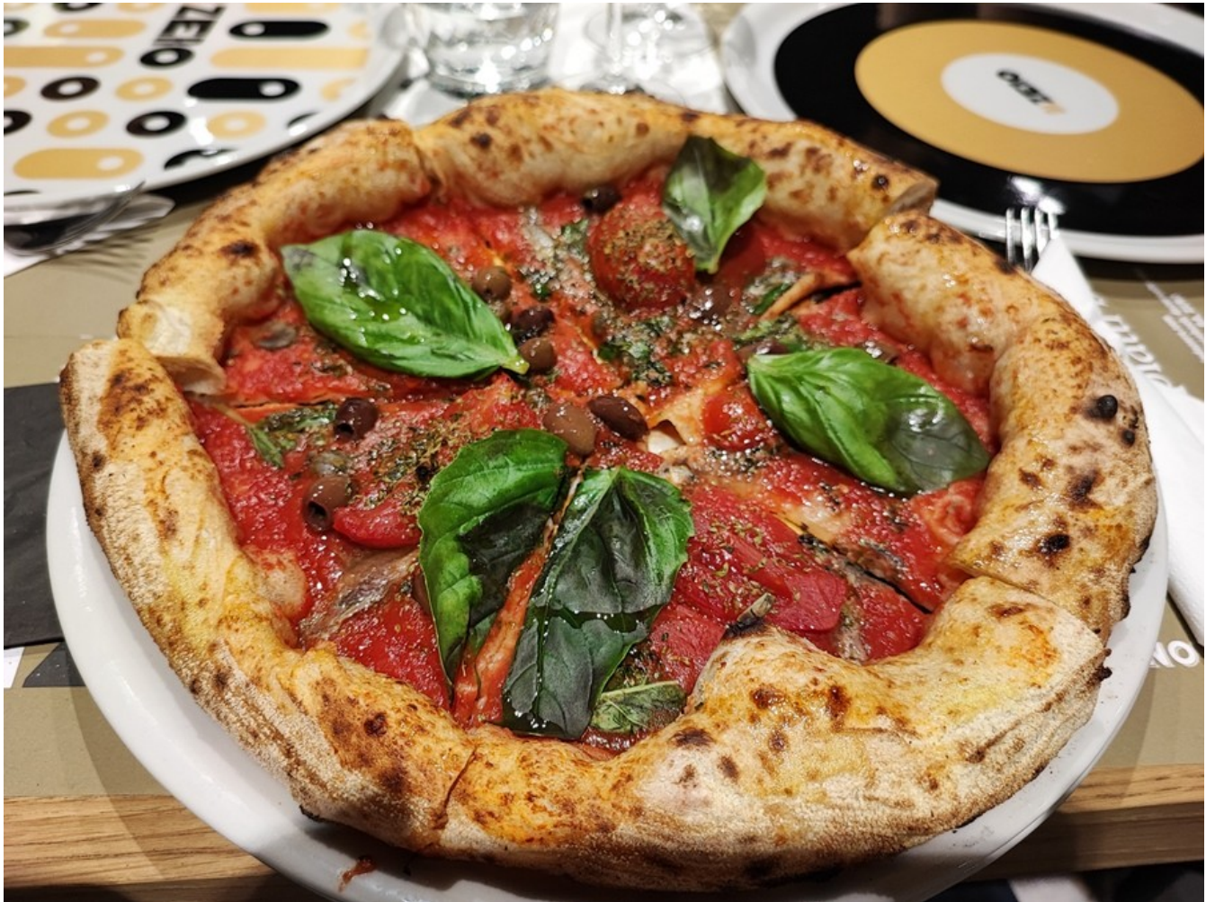
Pizza Marinara Cilentana.