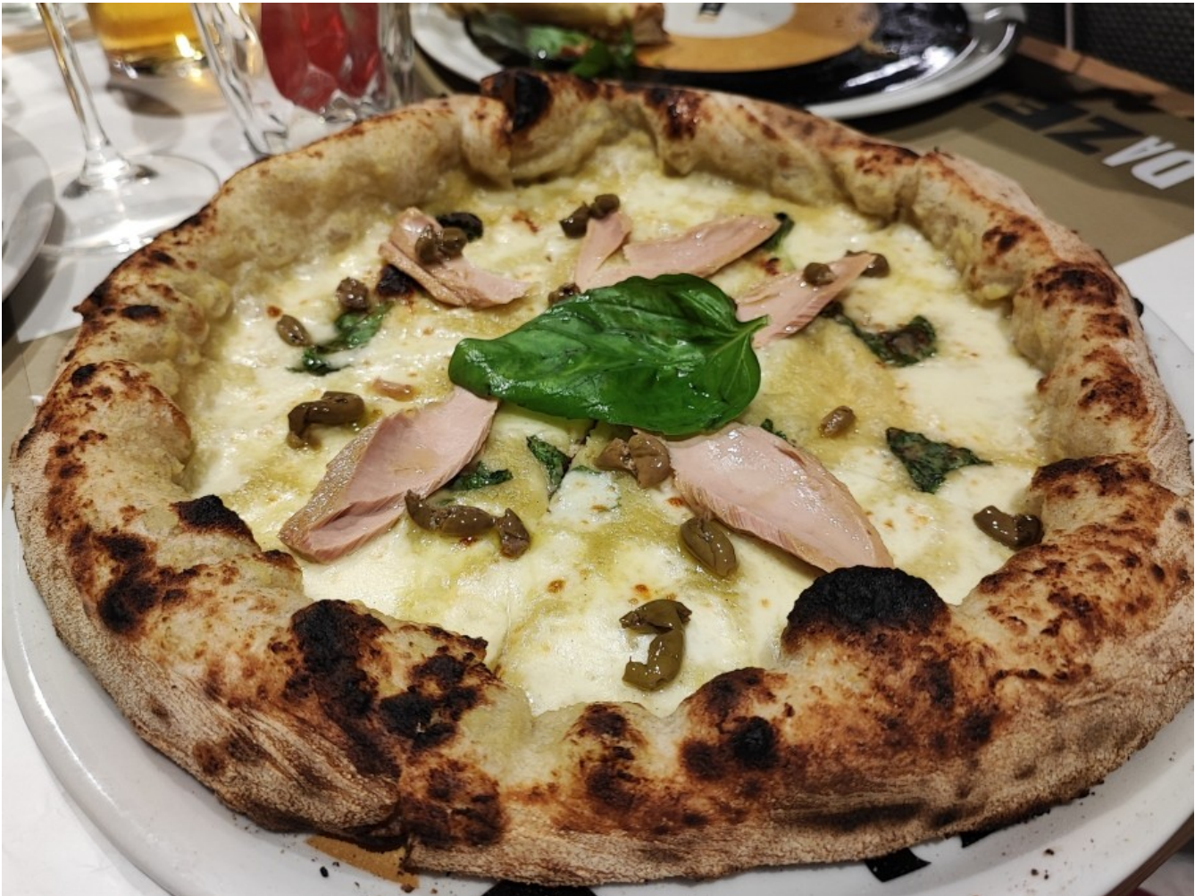
Pizza Tonno e Ammaccate

La “ Marinara cilentana ” è saporitissima nella sua semplicità: pomodoro, alici di Menaica e olive ammaccate; intrigante e piccante, invece, la pizza “ Incontro con il diavolo ” farcita con pomodorini del piennolo, origano Incontro, salsiccia piccante “Incontro”, mozzarella di bufala e peperoncino.