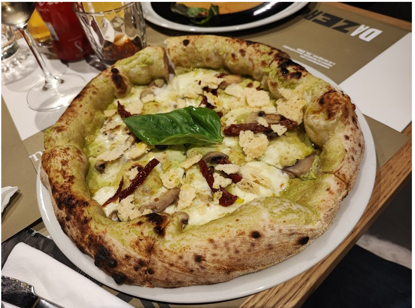
Pizza Vegetariana d'Inverno.

Le pizze, dalle classiche alle speciali, esprimono un equilibrio perfetto tra leggerezza e sostanza dei condimenti, mai troppo invasivi per non sovrastare la genuinità di un impasto soffice ai bordi e sottile al centro.