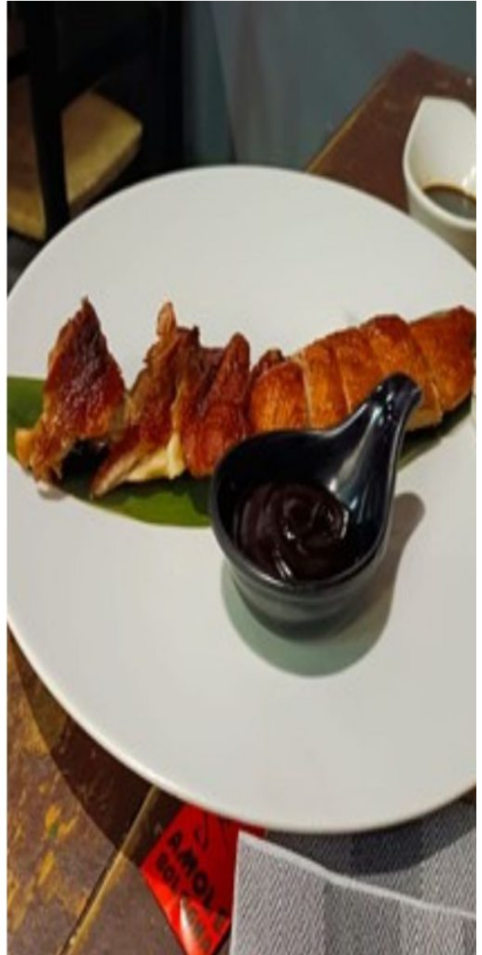
I gamberi kung pao e l'anatra al forno.

Se vi piace la buona cucina etnica e viaggiare senza spostarvi da Bologna, Amole è un locale originale e informale che trasporta nei sapori e negli odori dello Sichuan. Il tutto con un conto accessibile e onesto.