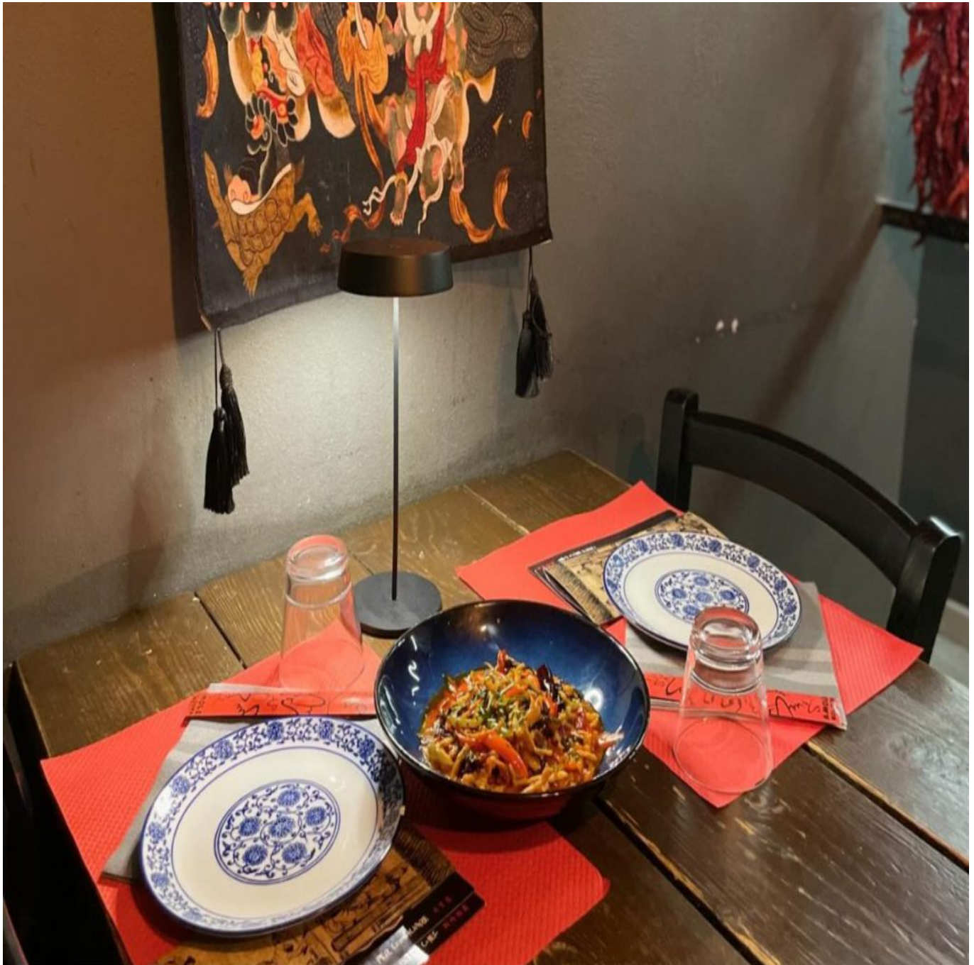
Amole offre la cucina di Sichuan a Bologna.