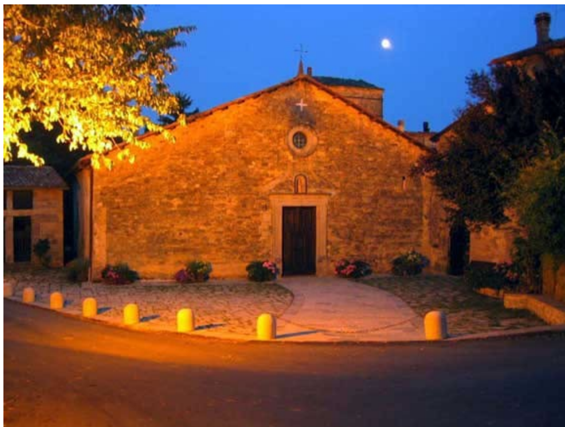
Antica Pieve di San Pietro di Roffeno

Ai più piccoli è dedicata la visita al parco incantato “la Birichinaia” dove prendono vita alcune tra le fiabe più conosciute e amate da tutti, grazie alle sagome che si trovano all'interno del parco, dipinte da artisti del territorio. Un luogo fiabesco, che in occasione di Grand Tour, ospiterà uno spettacolo di magia, tanti giochi di intrattenimento e una speciale merenda.