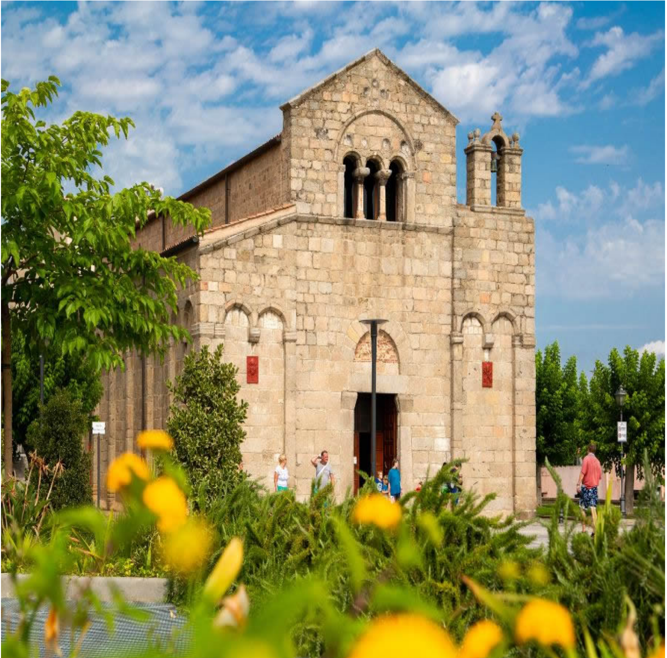
Basilica di San Simplicio, risalente all'XI secolo.

Le spiagge più gettonate di Olbia? Sicuramente quella di Pittulongu, le spiagge di Bados, di Porto Istana, Cugnana, Rena Bianca, Razza de Juncu, Spiaggia dei Sassi, Spiaggia delle Alghe, Spiaggia Ira.