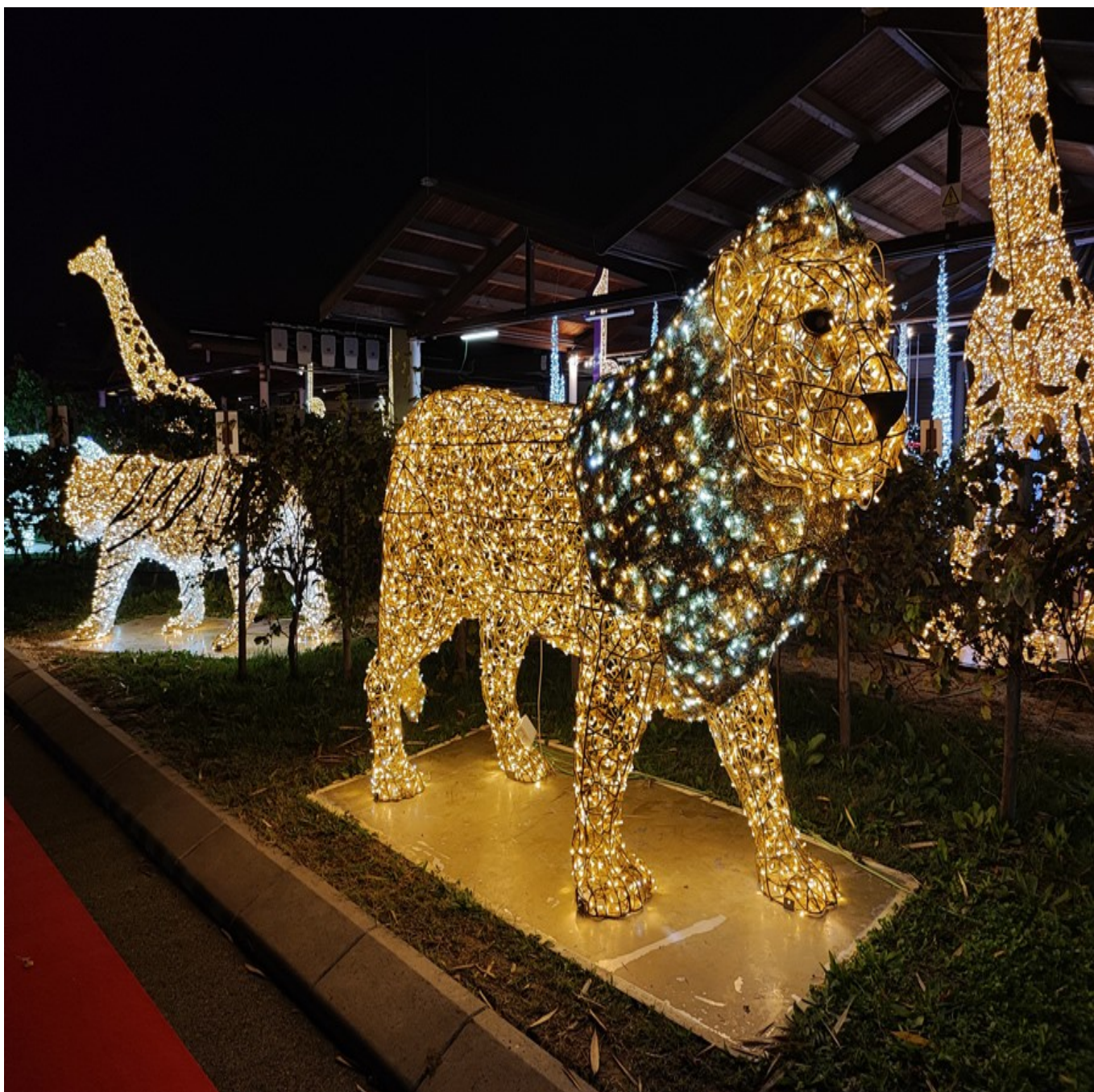
Lo Zoo di luci.

Ciò che colpisce di questo Christmas Village bolognese è l' abbondanza di luci e di installazioni con esse realizzate . Dagli animali della Savana nello "Zoo di luci" , a squali e delfini dell'Oceano da ammirare nel "Mondo sottomarino" . Scenografici anche i 12 Schiaccianoci da 3 metri di altezza che, silenziosi, "presidiano" il percorso e le installazioni di led dedicate alle favole più famose e amate dai bambini : da Alice nel Paese delle Meraviglie a Cenerentola.