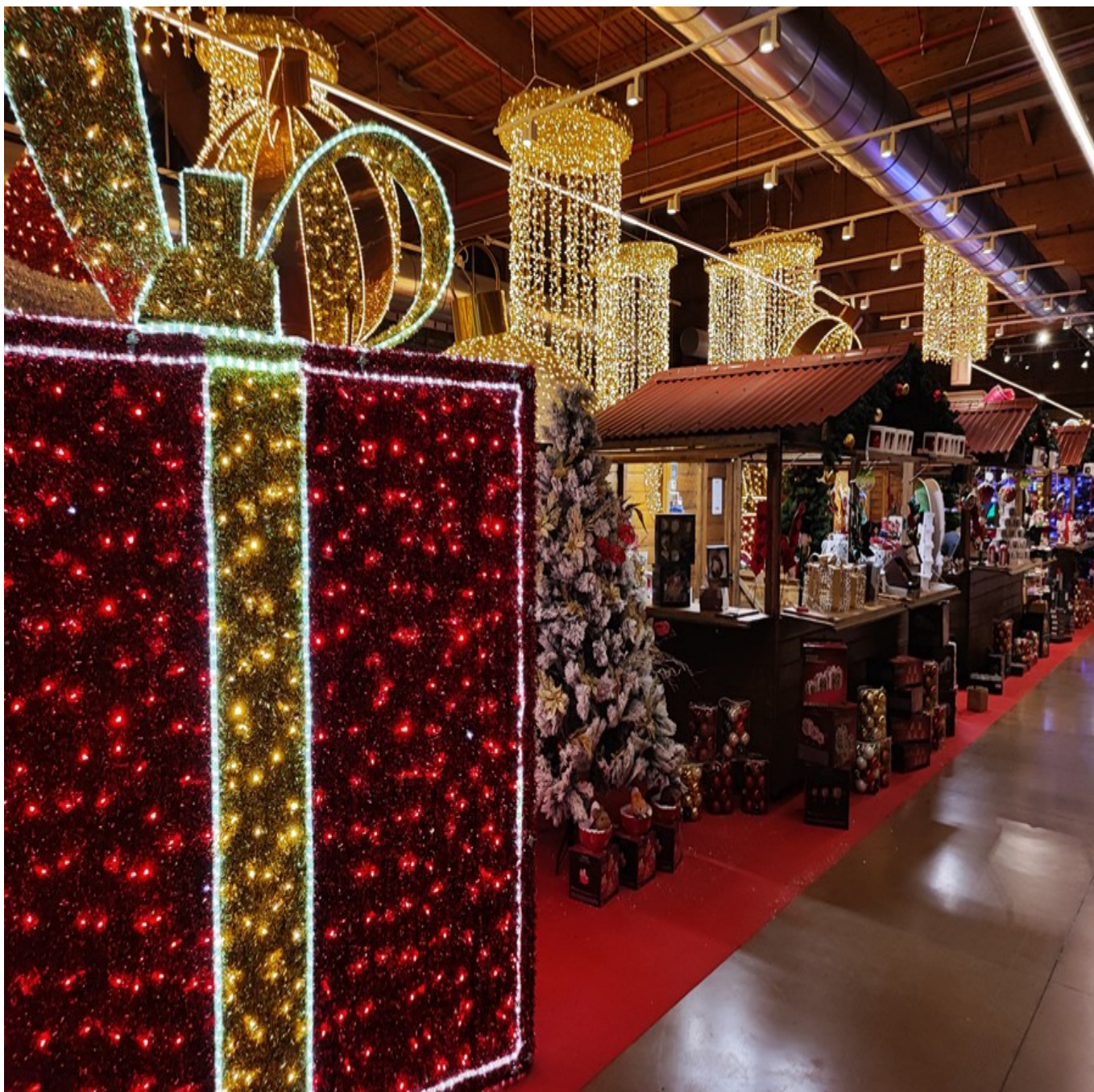
Gli stand per regali e cibo.