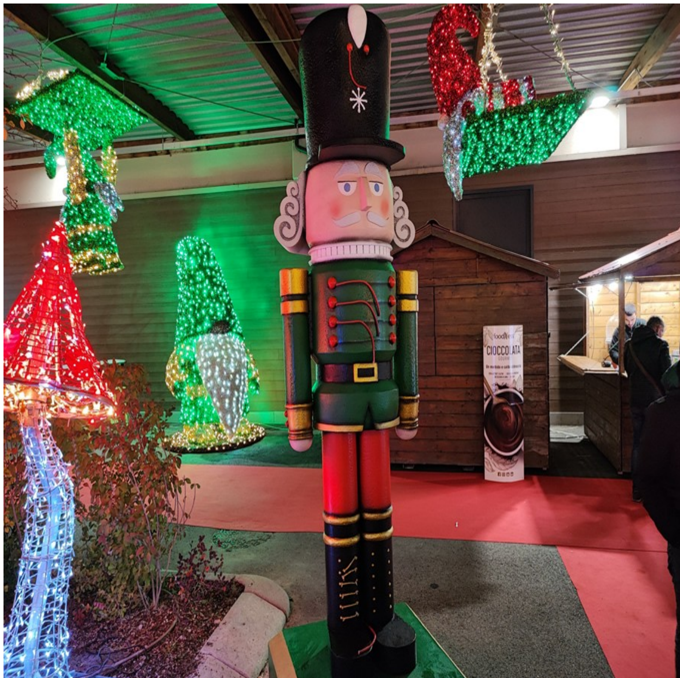
Nel Villaggio ci sono 12 Schiaccianoci da 3 metri di altezza.

Un lunghissimo tappeto rosso accompagna i visitatori nel mondo di Santa Claus e dei suoi aiutanti, sempre che non si decida di sperimentare il Polar Express , il trenino su rotaia che conduce direttamente nella casa di Babbo Natale al Polo Nord . Qui, i bambini scopriranno come costruisce, assieme agli elfi, i regali che poi consegna nella notte del 24 dicembre. A quest'ultima operazione si può partecipare grazie alla realtà virtuale che consente di volare a bordo della slitta trainata dalle renne , per la consegna dei doni ai bambini di tutto il mondo.